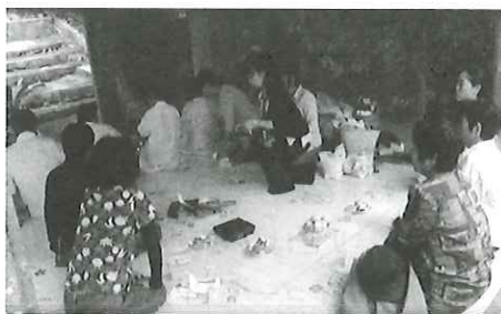
写真④ 大御嶽を詣でる村人達

集落の人々が三々五々、線香、酒、塩、煮干し洗米や賽銭を持って参拝に訪れる。一世帯ずつ順にこれらの品々を供え、ツカサが、神に世帯員の干支を告げ、各家庭のねがいことを述べて祈願する。村人は、神役からお茶・てんぶら等のもてなしを受けながら、しばらく談笑して過ごす。帰りの際は、神様からの贈り物である