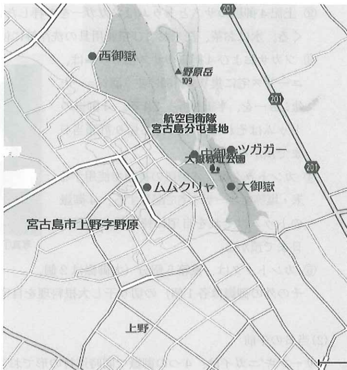
図1 祭場の位置関係