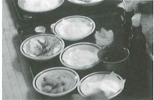
写真① 小瓶に入れた酒ジョー・供物を載せた盆ジョー