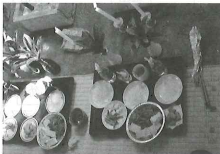
写真③ 献饌して集落の繁栄を祈る

各世帯1バリ、計120バリずつ焚く。10時頃、カントックが自治会からの供物である白トーフの煮付けと切り干し大根のための入った重箱を2個ずつ持って訪れる。トゥムは、トーフと切り干し大根を皿に入れ、各神役に手渡す。