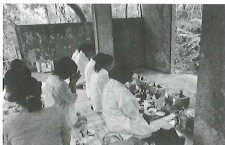
写真② 祈願する神役達

アンナイゴーが半分ほど燃えた頃、ツカサが目の前の香炉に自分のヤーキゴー（家庭の香）を焚き家族の健康・家の繁栄を祈る。次にユーザス・ミルクザス・チョウヌヌス・ヤクは順次、線香をツカサに手渡して世帯主の干支を言い、ニガイ°言葉を唱えてもらったうえで、各自の香炉に立てる。