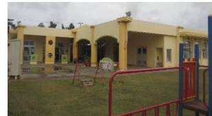
園庭側からの園舎