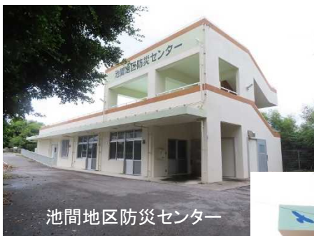
池間地区防災センター

大津波警報や津波警報が発表されたら、より高い安全な場所※へ速やかに避難することが大切です。