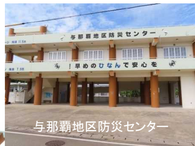
与那覇地区防災センター