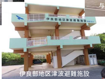
伊良部地区津波避難施設