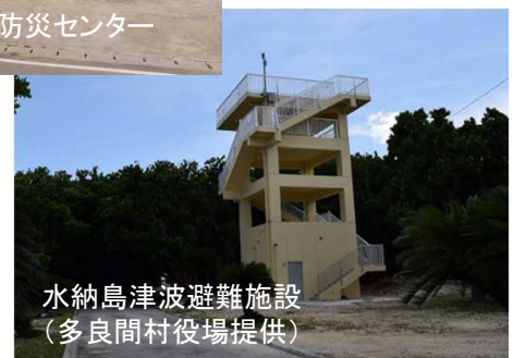
水納島津波避難施設