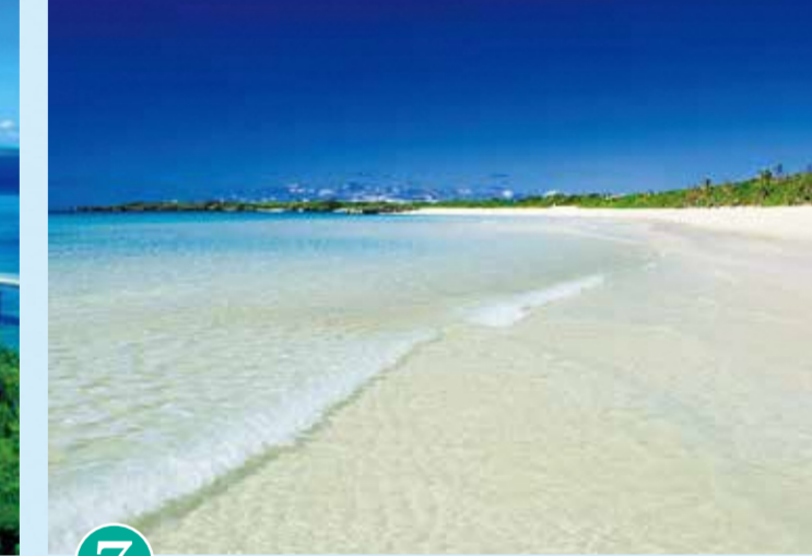
7 토구치노하마 (이라부지마)

● 쓰레기는 가져가 주세요. 그래야 언제까지나 아름다운 미야코지마를 유지할 수 있어요. ● 해변 주차 요금이나 샤워 이용 요금에는 현금(잔돈)이 필요해 사전에 준비를 하고 있어요! ● 오키나와현에서 가장 많이 발생하는 수난사고는 스노클링 중에 일어나는 사고예요. 구명조끼를 입고, 혼자서 바다에 들어가지 않게 주의해요! ● 산호를 만지거나 밟지 않도록 해요!