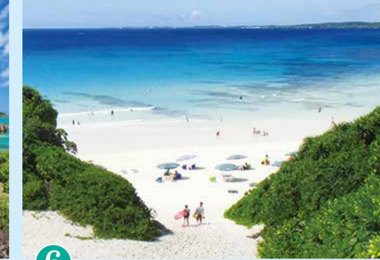
6 스나야마 비치 (미야코지마)