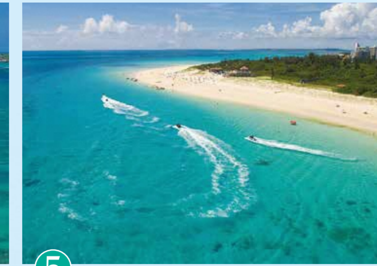
5 요나하 마에하마 비치 (미야코지마)