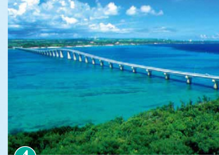
4 구리마 대교