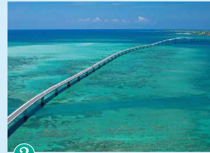
2 이라부 대교