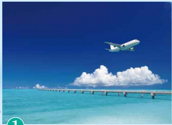
1 17END (시모지마 공항)