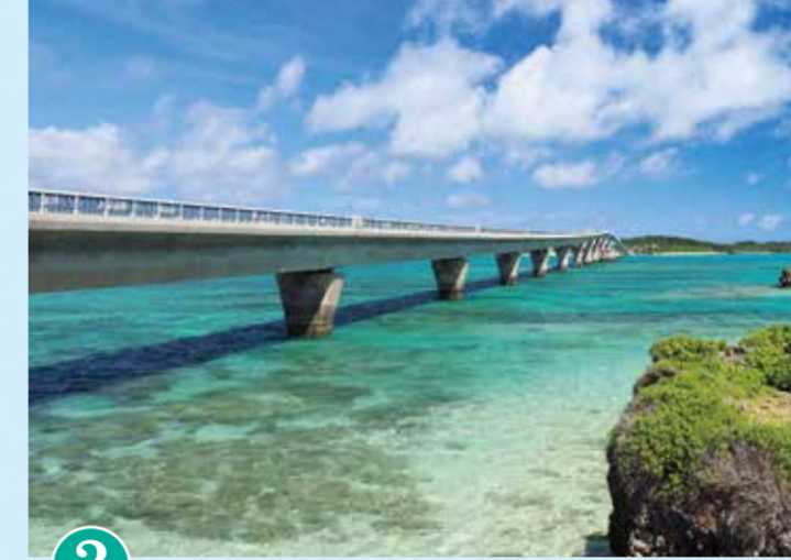
3 이케마 대교