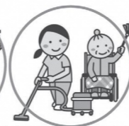
居室の掃除、ゴミ出し