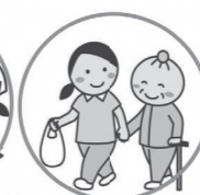
生活物品の買い物