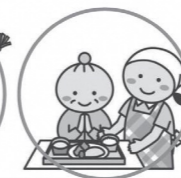
食事の準備、調理、片付け