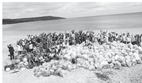
昨年開催の様子。みんなで協力してごみを集め、ビーチはピカピカになりました。

毎年3月5日(サンゴの日)を中心に「サンゴ礁ウィーク」が開催されます。「海 LOVE in 宮古島」は、美しい海を次世代まで残す活動の普及促進を目的に開催される海岸清掃イベントで、今年で4回目となります。ご家族みんなで、ぜひご参加ください!