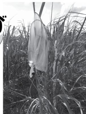
袋を被せて抜き取る