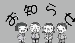
図 税務課 諸税係 ☎ 72-3751 内線 2443