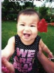
ねね 我如古 寧々ちゃん