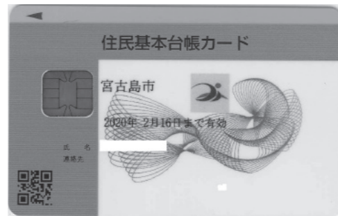
(住民基本台帳カード)

カード登録申請・利用サービスのお問い合わせ 市民生活課 ☎ 72-3751(代表)