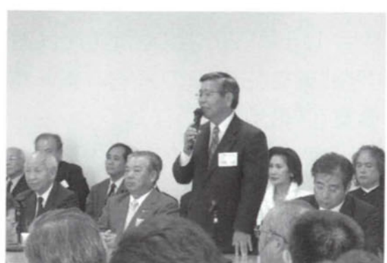
要請後の説明会のようす(東京衆議院第2会館)