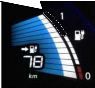
リーフ（24kWh）のバッテリー残量計の目盛り