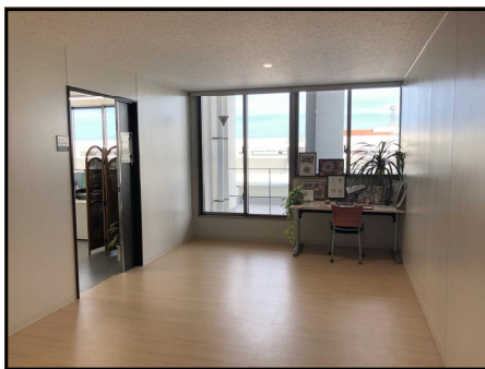
教育相談室 (総合庁舎3階西側の一角にあります。)

不登校の児童生徒が学校に行けるようになるまでの居場所づくりに努め、関係機関と連携を図りながら、児童生徒の悩みに向き合い、悩み解決を支援していきたいと思ひます。