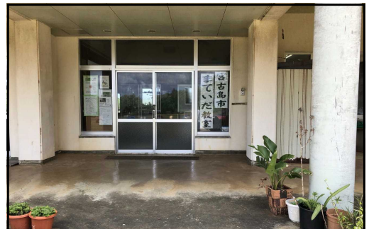
まていだ教室 (旧宮原小内幼稚園舎)

まていだ教室の児童・生徒にとって、安心できる居場所になるように、話し・遊び・楽しむ活動を通して自然な関わりを心がけながら、本人の学習の計画を見守り、共に学んでいきたいと思ひます。