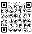
宮古島市の防災情報防災マップ