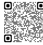
多良間村の防災情報防災マップ