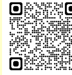
ワークシート（気象庁eラーニング教材）