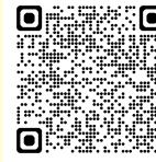
国土交通省マイタイムラインの詳細について